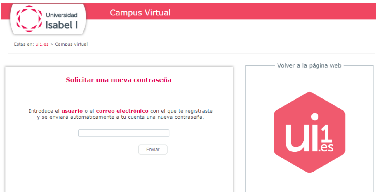
Imagen 4. Pantalla para solicitar una nueva clave de acceso al Campus Virtual

A continuación, te redirigirá a otra pantalla donde debes introducir tu nombre de usuario, y a continuación pulsar en el botón Enviar . Puedes ver la pantalla que te explicamos en la Imagen 4.